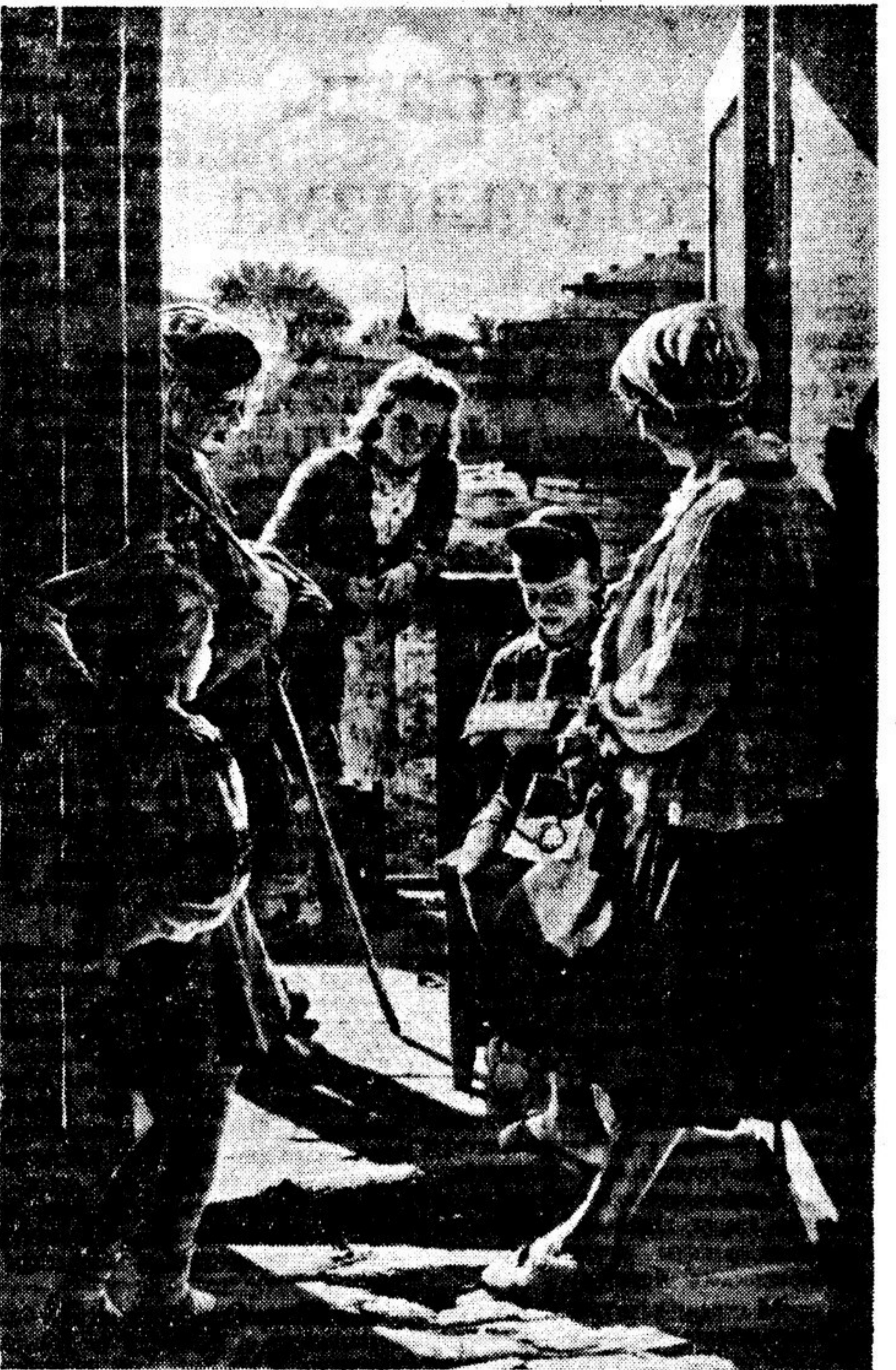
«ПИСЬМО С ФРОНТА»

Советские художники создали ряд талантливых произведений, правдиво изображающих нашу действительность. Но нам надо еще много и неустанно работать, чтобы достигнуть вершин мастерства русского классического искусства. Учась у великих художников прошлого, мы должны искать новые формы, которые в еще большей степени соответствовали бы духу нашего времени. Дальнейшим этапом развития советской скульптуры должен быть переход от индивидуального реалистического портрета к типическим, обобщенным, монументальным образам, от отдельных скульптурных фигур — к сложным композициям, выражающим величие нашей эпохи.